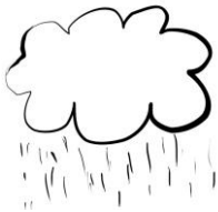
La pluie tombe