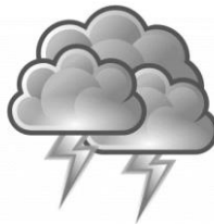
Le tonnerre gronde