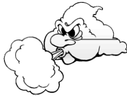
Le vent souffle